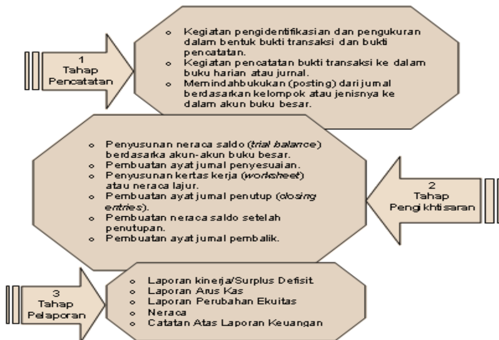
Gambar. 1 Tahap-tahap dalam Siklus Akuntansi

Tahap-tahap dalam siklus akuntansi dapat dibagi menjadi beberapa langkah berikut: